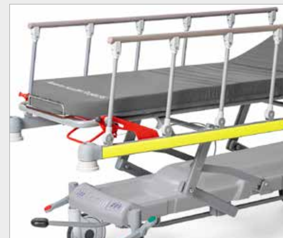
9BT9006 (TWISTER) Materasso imbottito 4 sezioni classe 1 IM PU (colore: Grigio). Sp. 60 mm - Class 1 IM 60 mm 4-section padded PU mattress (Grey)

SPECIALIST BEDS WARD FURNITURE PAEDIATRICS CONSULTING ROOMS & CLINICS TECHNICAL WALL SOLUTIONS CARTS STRETCHERS FURNISHING ACCESSORIES HEALTHCARE FACILITIES