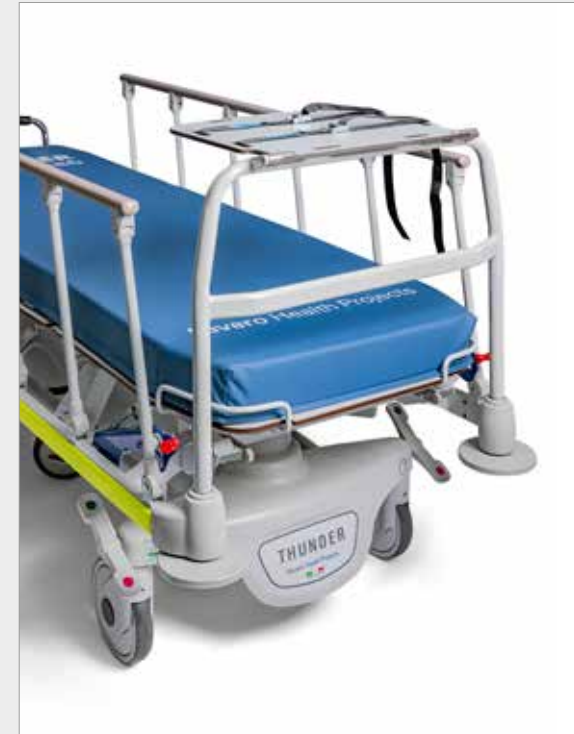
9BS9400 Ripiano portamonitor in acciaio verniciato. Piano in HPL abbattibile. - Monitor holder shelf in painted steel. Folding HPL top.